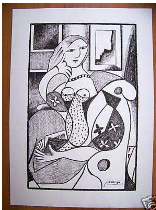
Pablo Picasso: "Donna con libro" (1932)

“Nella lettura l'amicizia è a un tratto ricondotta alla purezza originaria. Con i libri, niente convenevoli. Passiamo la serata con questi amici, perché lo desideriamo davvero. Loro, almeno, spesso li lasciamo a malincuore” (Marcel Proust: "Il piacere della lettura"). ).