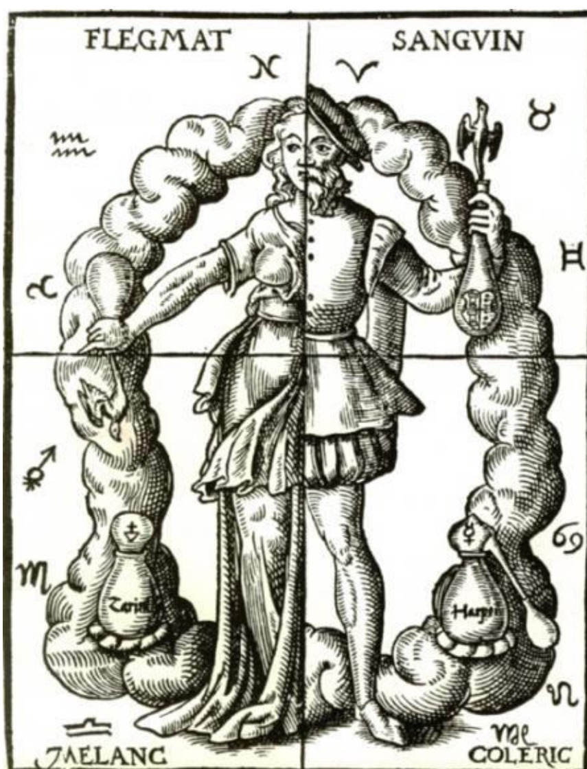
Fig 2: L'uomo zodiacale

Sia come sia, un invito alle persone intelligenti, chè delle altre non c'è da curarsi. Prima di emettere qualsiasi giudizio in materia, perché non ci si documenta un pò? Non immaginate quale TESORO di Cultura ci hanno tramandato gli antichi!!