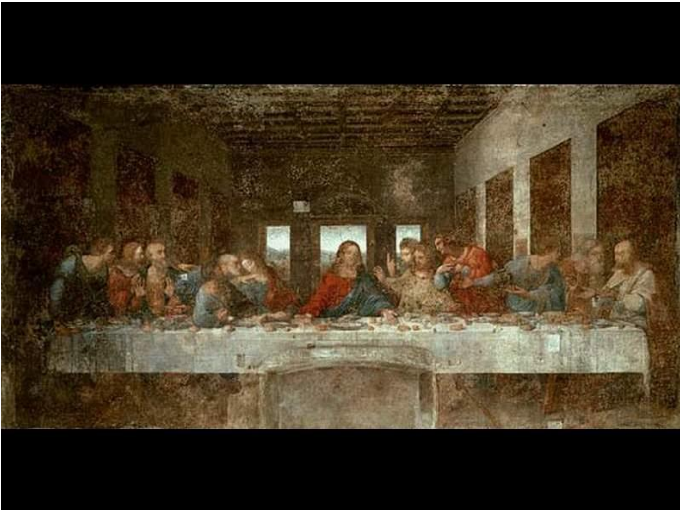
Fig. 3: L'ultima cena (Leonardo da Vinci)