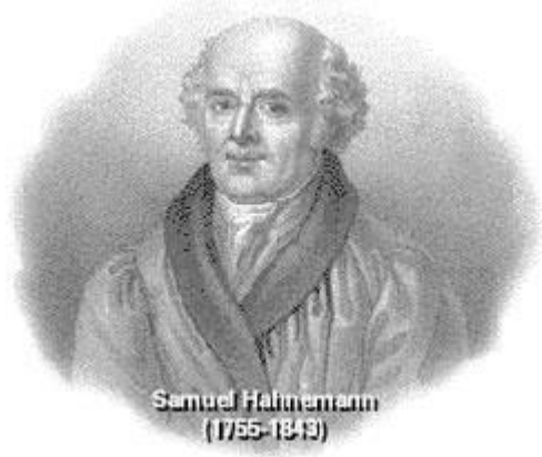
Samuel Hahnemann (1755-1843)

Hahnemann si laureò in medicina nel 1779 ed esercitò la professione per dieci anni a Lipsia, nel 1789 si rese conto dell'inadeguatezza delle dottrine mediche di quel tempo ed intraprese il lavoro di traduttore di testi per guadagnarsi da vivere.