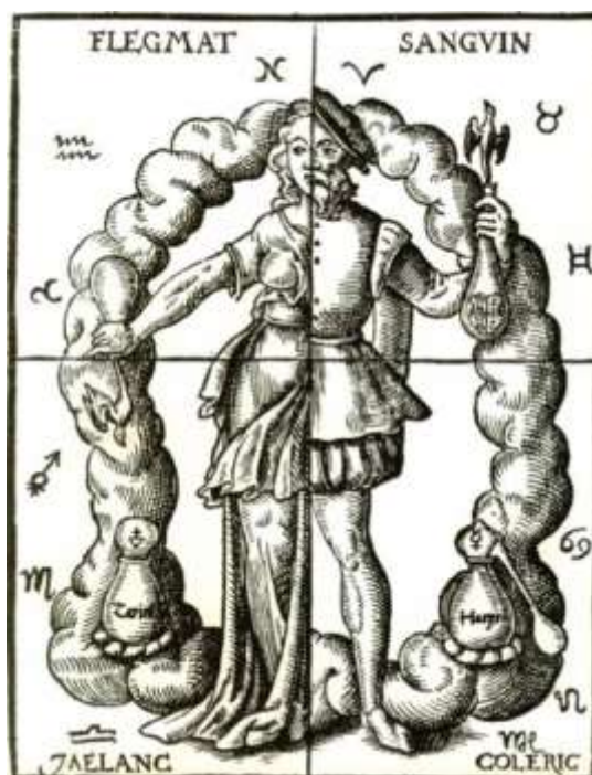
Fig 2: L'uomo zodiacale

Il ciclo vegetale si riflette dunque nel cielo dello zodiaco, i loro simbolismi corrono paralleli 2 .